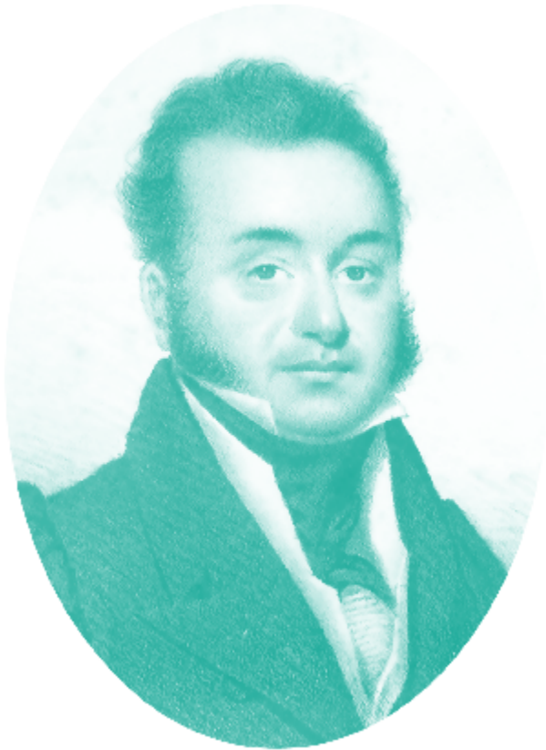
Lorenzo de Zavala

Grabado publicado en Ensayo Histórico de las Revoluciones de Méjico (sic) , desde 1808 hasta 1830 (t.I, Imprenta P. Dupont et G. Laguione, París, 1831).